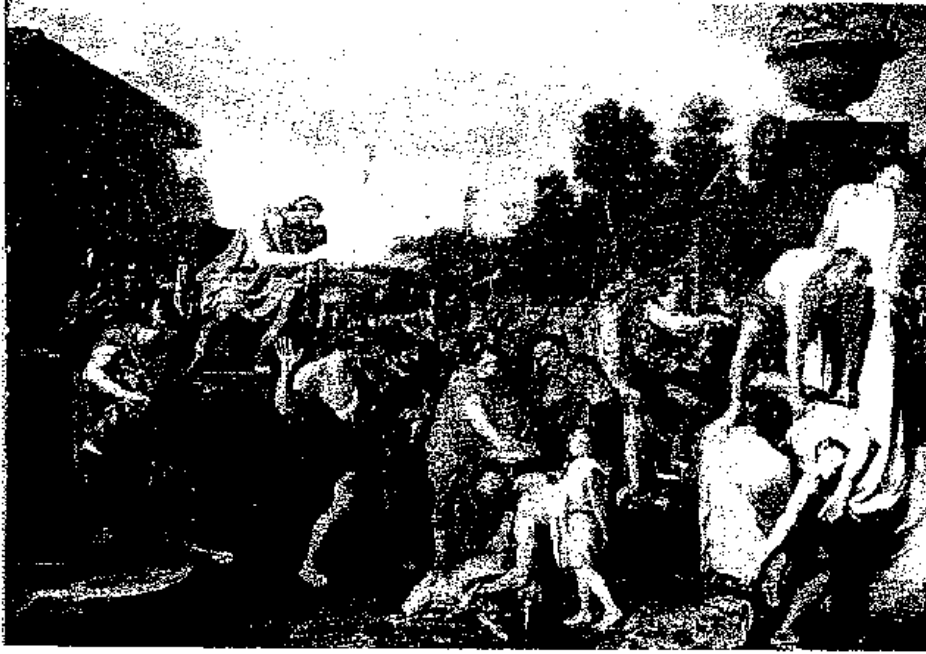
圖一 Charles Le Brun, Mucius Scaevola before Porsena . 1643-5, 0.96 × 1.34 cm. Musée municipal des beaux-arts, Mâcon.