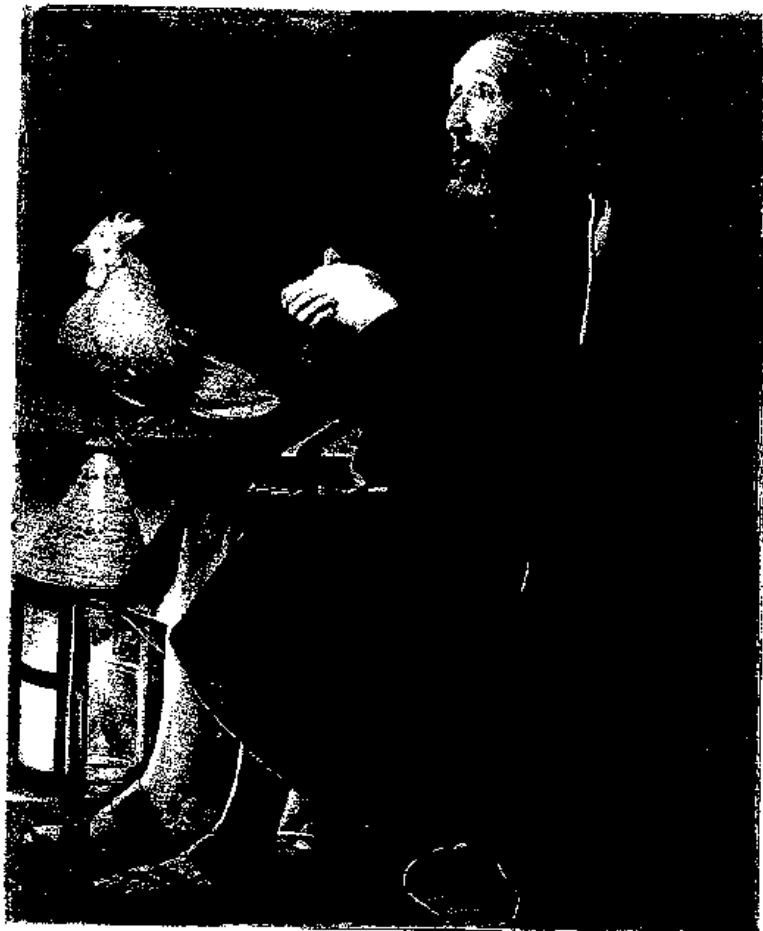
圖二 Georges de la Tour (French, 1593-1652), Saint Peter Repentant . 1645. Oil on canvas, 114 × 95 cm. Cleveland Museum of Art, 1995, gift of the Hanna Fund, 51.454.