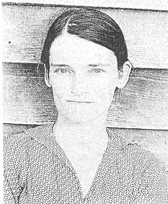
右：《After Walker Evans》, Sherrie Levine, 1981